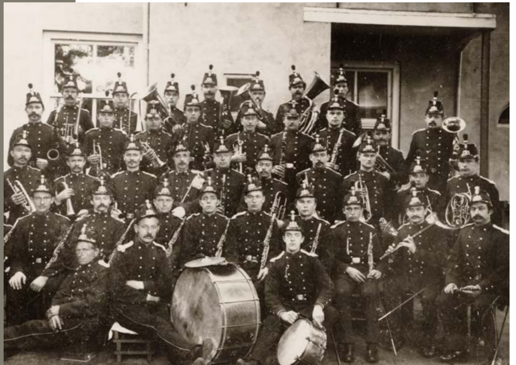
Leden van harmonie Orpheus, circa 1895-1896

T ilburg is altijd een bruisende muziekstad geweest. Wat ooit begonnen is met het elitaire muziekgezelschap Collegium Musicum, vloeide uit in een reeks harmonieën, fanfares en zangkoren voor de hele Tilburgse volksklasse. Eigenlijk zijn de handboog- en kruisbooggilden de eerste verenigingen. Die werden na de kruistochten opgericht om eigen volk, aard en cultuur te bewaken en te verdedigen. Tijdens de gildefeesten werd op trommel of hoorn gespeeld. Daar ligt in feite de oorsprong.